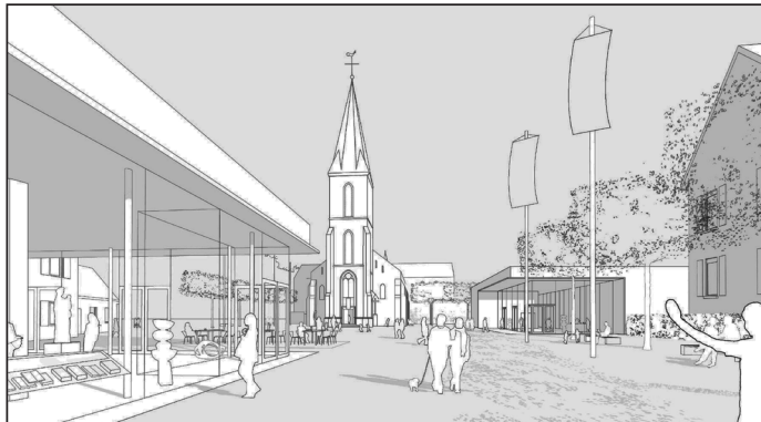
Skizze: Ansicht Kirchplatz mit neuem Gemeindezentrum

Unter dem Aufruf: Wir Alle sind gefragt wollen wir in Zukunft gemeinsam helfen den nicht finanzierten Eigenteil für notwendige Anschaffungen gemeinschaftlich aufzubringen.